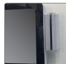
磁気カードリーダー