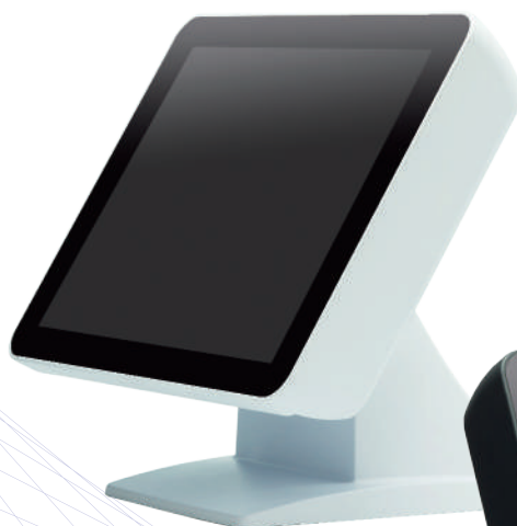
据置型 QR スキャナー A-860 (別売)