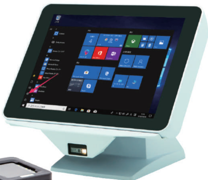
1D/2D スキャナー搭載モデル