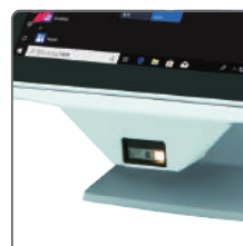
1D/2D バーコードリーダー