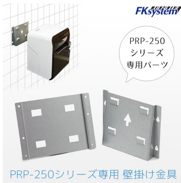
PRP-250 シリーズ専用 壁掛け金具 型名：WMK-250